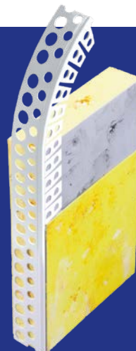
Rundbogenprofil Genius PVC

Unsere Rundbogenprofile Genius und Perfekt sind die optimale Ergänzung in unserem Sortiment für anspruchsvolle Anwendungen. Rundbögen, konvex/konkav verlaufende Wände oder kreisförmige Wanddurchbrüche sind mit unseren Profilen kein Problem.