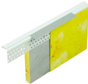
156600 Abschlussprofil PVC mit herausziehbaren Abdeckstreifen