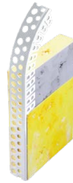
111400 / 111500 Rundbogenprofile Genius und Perfekt PVC für Türbögen etc.