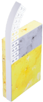
156800 Lichtensteiner Profil Perfekt Rundbogen PVC