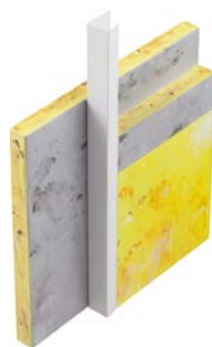
150100 - 150600 Einfassprofile L-Form PVC (9,5 - 25 mm)