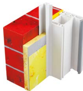
160200 - 160300 Laibungsprofil L-Form PVC selbstklebend mit Bewegungsaufnahme