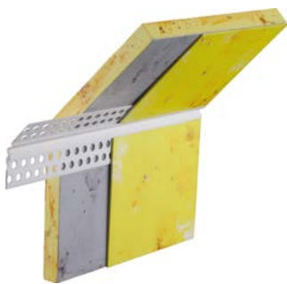
153300 Bewegungsfugenprofil Trockenbau PVC für den Eck- und Drempelbereich