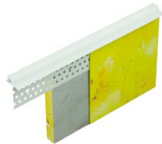
158400 Abschlussprofil PVC mit Weichlippe