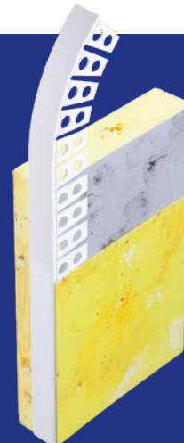
Lichtensteiner Profil Perfekt Rundbogen PVC