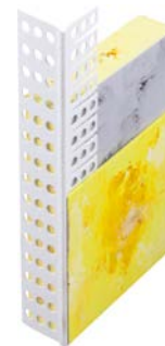
159000 Rundbogenprofil PVC mit breiter Sprachtellkante