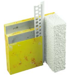
15200 Schattenfugenprofil PVC für flexible und schöne Wandabschlüsse