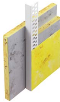
111300 Lichtensteiner Profil Perfekt PVC mit geradem Abschlussprofil