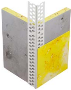
111100 Eckprofil Genius PVC mit runder Kante

Für Fragen und Anregungen stehen wir jederzeit gerne zur Verfügung.