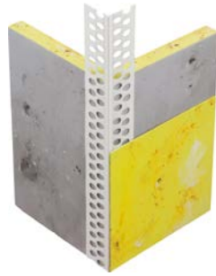
111200 Eckprofil Perfekt PVC mit scharfer Kante