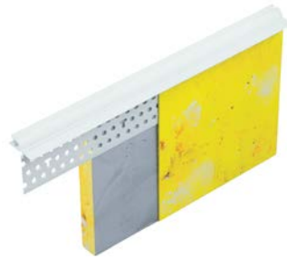
158400 Abschlussprofil PVC mit Weichlippe