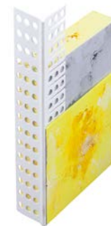
159000 Rundbogenprofil PVC mit breiter Sprachtellkante