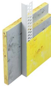
111300 Lichtensteiner Profil Perfekt PVC mit geradem Abschlussprofil