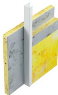
150100 - 150600 Einfassprofile L-Form PVC (9,5 - 25 mm)