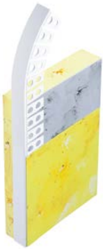
156800 Lichtensteiner Profil Perfekt Rundbogen PVC