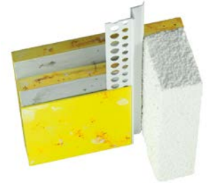
15200 Schattenfugenprofil PVC für flexible und schöne Wandabschlüsse