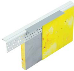
156600 Abschlussprofil PVC mit herausziehbaren Abdeckstreifen