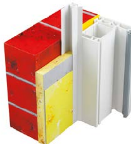
160200 - 160300 Laibungsprofil L-Form PVC selbstklebend mit Bewegungsaufnahme