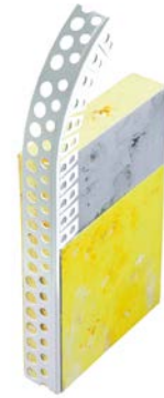
111400 / 111500 Rundbogenprofile Genius und Perfekt PVC für Türbögen etc.