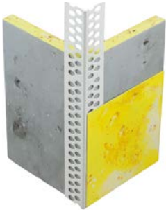
111100 Eckprofil Genius PVC mit runder Kante

Für Fragen und Anregungen stehen wir jederzeit gerne zur Verfügung.