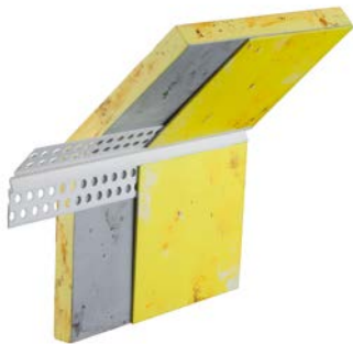
153300 Bewegungsfugenprofil Trockenbau PVC für den Eck- und Drempelbereich